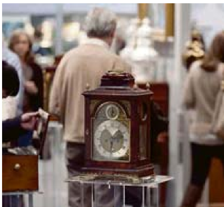
Una de las piezas presentes en la pasada edición de Feriarte. eE

Desde muebles que datan del año 246 a.C, a objetos con un mínimo de 100 años de antigüedad, pintura antigua y contemporánea, esculturas, relojes, porcelanas, lámparas, joyas, arte oriental, o cristal, serán algunos de los objetos que se presentarán en Ifema.